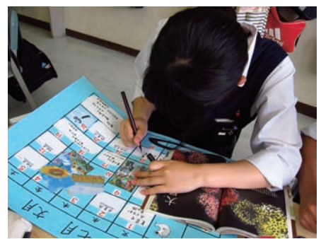
カレンダーを作成する生徒の様子