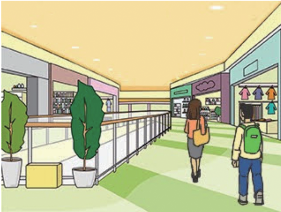
【ショッピングセンター】