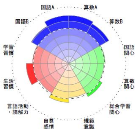
表 1 平成 21 年度調査の「全国学力・学習状況調査結果チャート [児童生徒]」の領域名と対応項目一覧