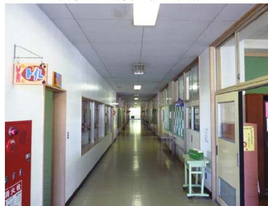
中廊下（両側が教室、晴れ）