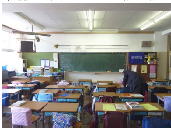
普通教室（中廊下・バルコニー有り、晴れ）

全点灯 1,460～320ルクス → 部分消灯(1/3) 1,400～310ルクス