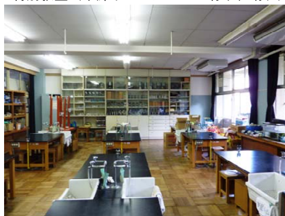
特別教室（中廊下・バルコニー有り、晴れ）

全点灯 1,460～320ルクス → 部分消灯(1/3) 1,400～310ルクス