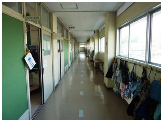
片廊下（左側が教室、右側は外部、晴れ）