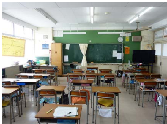
普通教室（片廊下・バルコニー無し、晴れ）

全点灯 5,400～640ルクス → 部分消灯(窓側1/3) 5,400～390ルクス