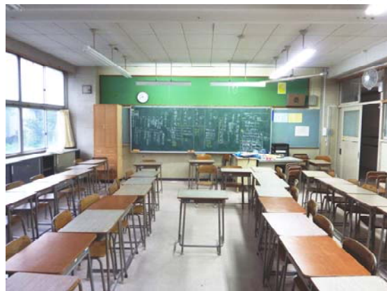
普通教室（片廊下・バルコニー無し、曇り）

全点灯 1,310～420ルクス → 部分消灯(窓側1/2) 530～300ルクス