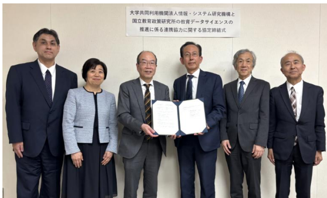
国立教育政策研究所と情報システム・研究機構の関係者

今後、それぞれが有する強みを生かして、学校風土の改善や生成AIの教育利用可能性等に関する研究協力の推進、研究者等の交流・情報交換、教育データや取組を共有するための基盤整備、教育データサイエンスの普及等において、連携協力して取り組んでいきます。