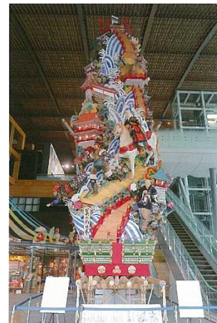
博多祇園山笠(国指定重要無形民俗文化財)の飾り山笠の題材に、開館10周年記念特別展「美の国 日本」が選ばれました