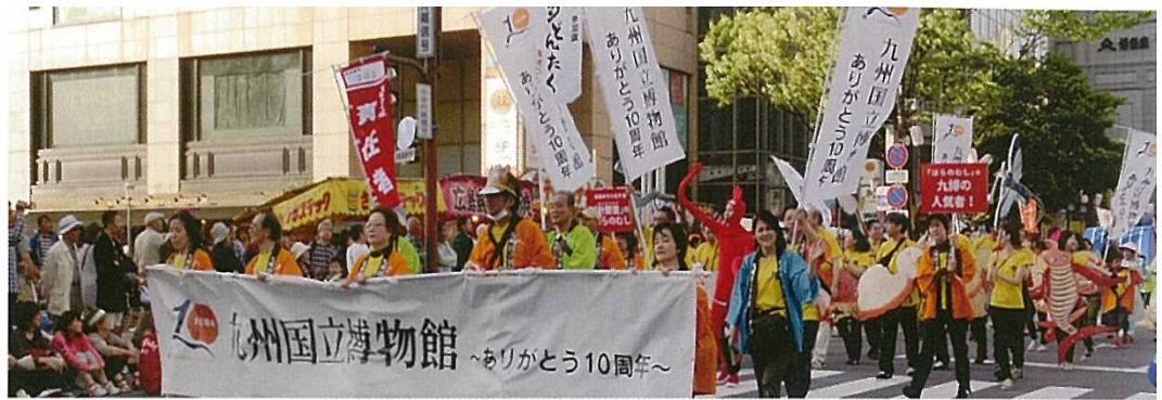
開館前の平成17年にも参加した「博多どんたく港まつり」に再び参加。10周年をPRしました(5月4日)