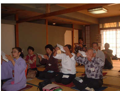
「落語を楽しもう」扇子を盃に見立てる