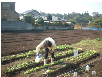
作物の消毒をする受講生