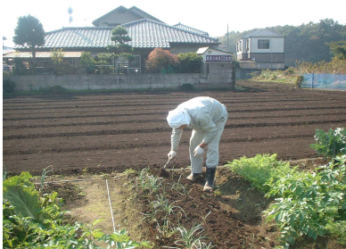
作物の成長を見る受講生