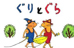
『ぐりとぐら』文・中川李枝子 福音館書店 1963年

絵本『ぐりとぐら』で有名な山脇百合子の絵本原画展。山脇は1962年に、童話『いやいやえん』（文：中川李枝子）の挿絵でデビューし、今日までに数々の絵本や童話を手がけています。本展はその原画約300点で構成される初めての大規模な回顧展です。