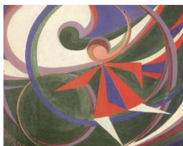
ジャコモ・バッラ 《輪を持つ女の子》 1915 年

館内は、1 階に企画展示室、2 階に常設展示室があり、年 4 回の特別展、5 回の所蔵品展を開催しています。特別展は、茶の湯、イタリア美術、絵本原画展など、多彩なテーマで企画されますが、