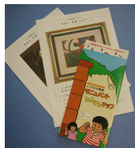
所蔵作品、彫刻などのガイド類

美術館ボランティアによる「常設説明グループ」が結成され、来館する学校などの対応にあたるほか、月 1 回のペースで所蔵作品をピックアップして解説する「やさしいアート・ガイド」を開催しています。また、館が近隣の福山市立女子短期大学の学生たちと協力して作成したゲーム形式の野外彫刻のガイド「モニュメントたんけんマップ」は子どもたちに大人気です。