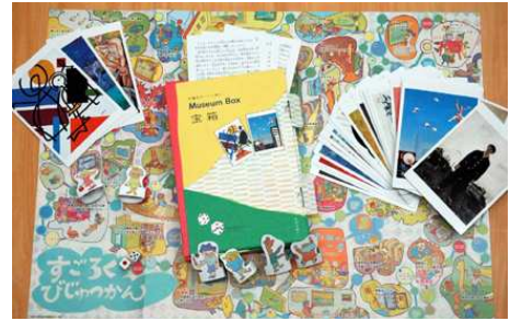
「Museum Box 宝箱」

このプログラムで使用した美術館キット「Museum Box 宝箱」には、美術館収蔵品約1万点の中から選んだ代表作品56点のカードと、美術館の裏舞台を描いたオリジナルすごろく「すごろく美術館」などが入っています。ミュージアムショップで販売（税込み2000円）するほか、教育機関には無料で貸し出ししており、実際に授業でも活用されています。