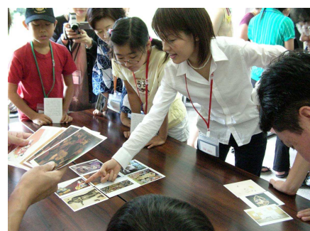
鑑賞プログラム「謎解き宝箱」の様子（2006年8月）

平成18年度文部科学省委嘱事業「文化体験プログラム」の一環として、湘南地域文化体験プログラム実行委員会（神奈川県立近代美術館＋逗子市教育委員会＋鎌倉市教育委員会＋葉山町教育委員会＋NPO法人STスポット横浜）が主催し、 みる・きく・はなす・かんがえる・つたえる・いっしょに考える という「考える力」「言葉の力」を育み、子どもも大人も楽しめる参加型のプログラムを、1年間展開いたしました。