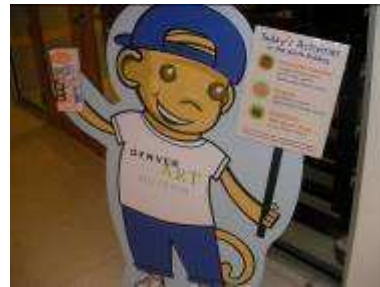
デンバー美術館のキャラクター 「シーモア」

ランディ・コーン アソシエーション http://www.randikorn.com/