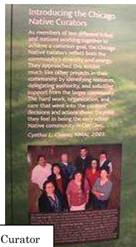
アメリカンインディアン美術館 Native Curator

シアトル美術館では、ダウンタウンの本館が現在一時閉館していることから、姉妹館のアジア美術館で本館の収蔵品も展示し、親子が気軽に美術館に入り、こどものためのスペースや展示室内で、リラックスして一緒に展示をみて過ごしている姿がみられた。