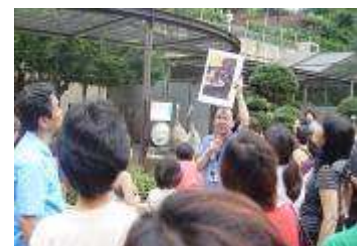
動物園で解説する博物館研究員

博物館の展示を前に、動物園の職員が展示作品に見られる動物の種類と生態について語り、博物館職員が、動物園で実際にその動物、虎、ライオン、象、鶴や鷹などを前に、美術作