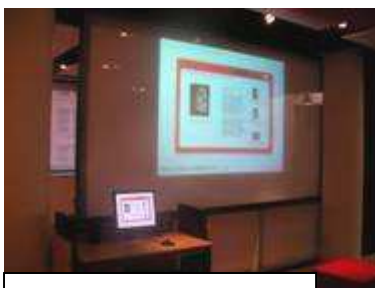
SFMOMA の エデュケーションセンター