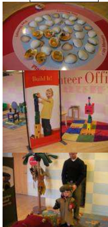
ファミリーセンター