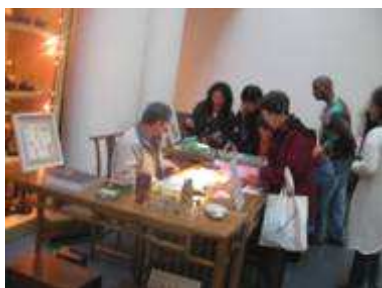
サンフランシスコ・アジア美術館 ショップ前のデモンストレーション

スミソニアンのアメリカーンインディアン博物館では、現地のコミュニティがキュレーターとして展示に関わる (Native Curator)。展示室でさまざまな参加体験ができ、強いメッセージ性を持った展示を行っていることが興味深い。