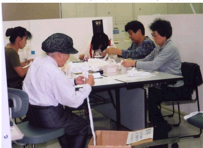
【作品保存用品制作の様子】

愛知県美術館友の会はその目的に、美術館活動への支援を含んでいます。会員有志により広報や教育などで多くのサポートを頂いていますが、一つのグループでは作品をより安全に展示・保存するためのクッションや、錘用の布袋、彫刻1点ごとの専用カバーなどを制作しています。保存担当学芸員から作品の素材と環境や経年による劣化などについての小講義もあり、参加者は作品への愛着が増し、展示を見る目も変わっているようです。