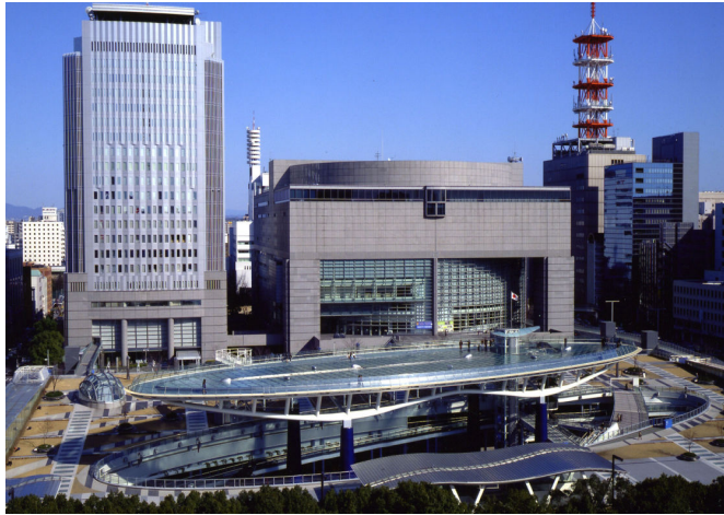
【愛知芸術文化センター外観】

愛知芸術文化センターは、平成4年10月30日栄地区にオープンした①愛知県美術館、②愛知県芸術劇場、③愛知県文化情報センターがお互いに連携し、ひとつになって、芸術文化の情報を発信していくという、国内では初めての複合的な大型文化施設です。名城地区には平成3年4月にオープンした愛知県図書館があります。