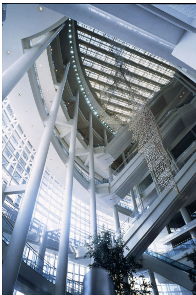
【愛知芸術文化センターフォーラム】

年間5回ほどの企画展は、歴史に残る優れた芸術家の回顧展や現代的なテーマによるグループ展、国際規模のものから地域に密着したものまで様々な展開しており、愛知県域で活動する若手作家を紹介する個展なども随時おこなっています。