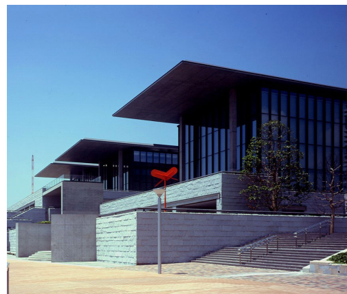
【美術館外観 海側からのぞむ】

兵庫県立美術館は、平成14年（2002年）4月に「震災からの文化の復興のシンボル」として神戸東部新都心（HAT神戸）に開館した美術館で、地域に根ざした美術館を目指しています。世界的に著名な建築家安藤忠雄氏によって設計された建物は、延床面積、27,461㎡という日本最大級の規模であり、北には六甲山系を、南には瀬戸内海と神戸港の風景を臨む美しい環境に位置しています。震災の教訓から、来館者と作品を守るために地下に免震装置が設置され、仮に再び阪神・淡路大震災クラスの地震が起こったとしても満水のコップの水が揺れる程度の構造になっています。