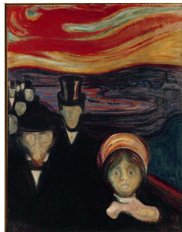
《不安》1894年 オスロ市立ムンク美術館 ©Munch Museum, Oslo

ノルウェーを代表する芸術家エドヴァルド・ムンク(1863-1944)は、近代人の孤独や頹廃を描いた象徴主義的作品によってわが国でも広く親しまれています。今回の展覧会では、「吸血鬼」、「不安」、「声／夏の夜」といった代表作に加え、これまで紹介される機会があまりなかった建築物の装飾プランなど、108点の作品をご覧いただけます。装飾との関連でムンク芸術を読み解く本展は、彼が自作をどのように見せようとしていたのかを視野に入れて作品を展示する初めての試みとなるでしょう。