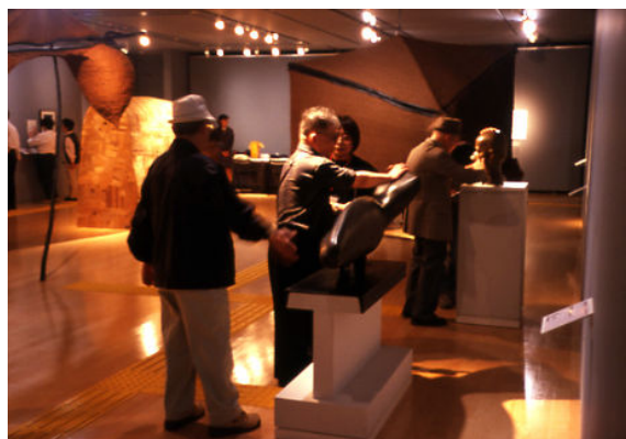
【「美術の中のかたち」展覧会場風景 ブロンズ彫刻に触れて鑑賞する】

①視覚に障害がある人にも美術館に足を運んでいただきたいという思いから、彫刻をはじめとする立体的な作品に、手で触れて鑑賞していただくことのできる「美術の中のかたち」と名づけた企画展を毎年開催しています。