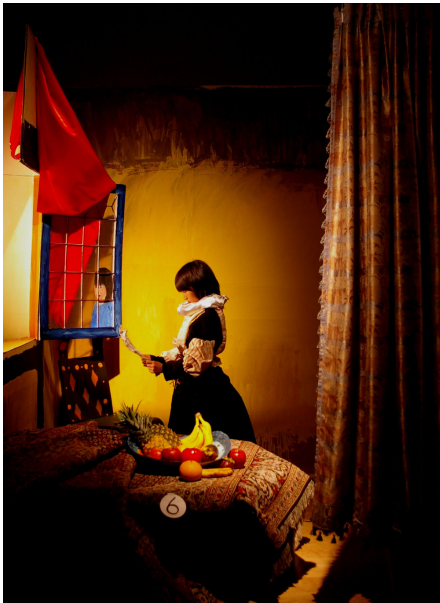
【「ドレスデン国立美術館展—世界の鏡」 関連こどものイベント作品 フェルメールの絵をみて、その世界を再現】

②子どもたちが美術館を身近に感じ、親しみを持てるように、学校の団体鑑賞を積極的に受け入れ、小学校の団体鑑賞では、ミュージアム・ティーチャーが当館所蔵の近・現代美術作品を用いてギャラリー・トーク（対話型鑑賞）を実施するとともに、毎月1回「こどものイベント」と題し、県内の小中学生を対象に、展覧会鑑賞と、それにちなんだ美術制作を組み合わせたワークショップ・プログラムを開催しています。