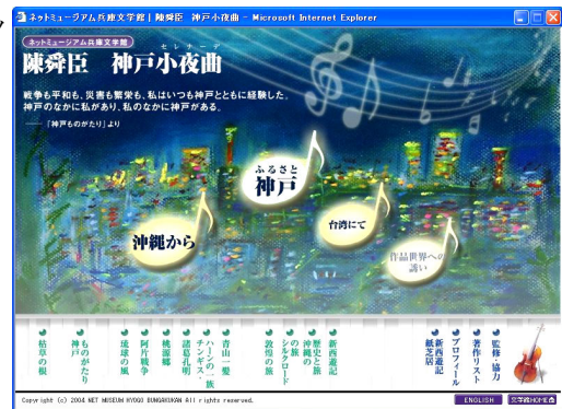
【ネットミュージアム兵庫文学館のホームページ画面】