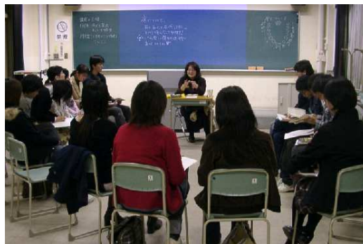
【NPOによるボランティア講座の様子】