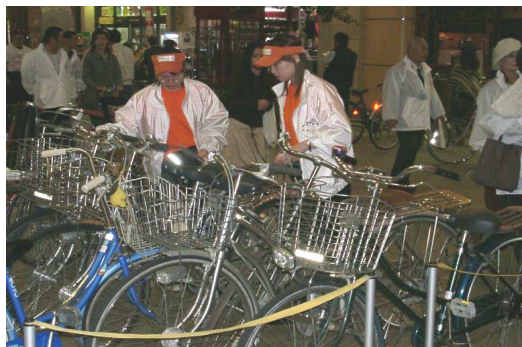
【学生によるボランティア活動の様子】

⇒ http://www.npo.coms.or.jp/volunteer_h17/index.html