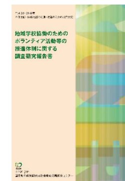
地域学校協働のためのボランティア活動等の推進体制に関する調査研究報告書