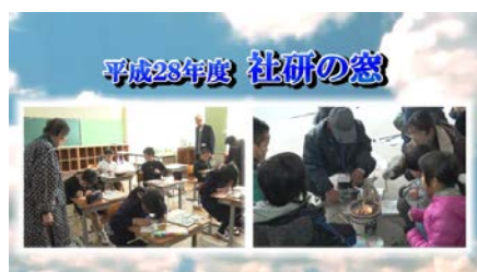
平成28年度社会教育情報番組『社研の窓』