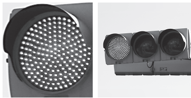
【発光ダイオード式信号機】